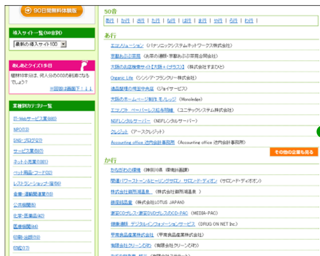
【導入サイト一覧】ページ

「導入サイト一覧」ページに導入したサイト名と企業名を掲載し、リンクを張る事ができます。 ※有料版をご購入いただいたサイトのみ掲載させていただきます。