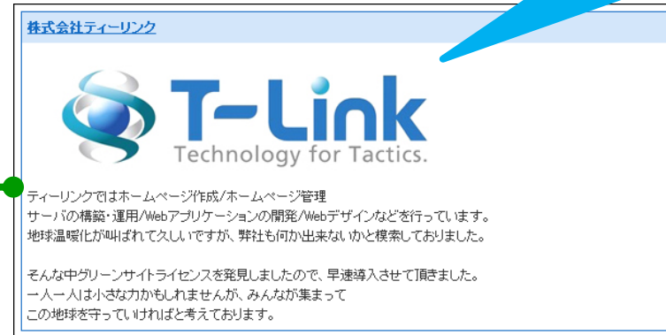
自社の取り組みを掲載してPR!