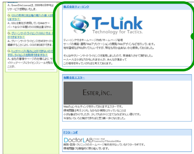
「導入企業様からの一言」ページ

「導入企業からの声」のページに応援メッセージを投稿して、自社の取り組みをPRすることができます。グリーンサイトライセンスを導入した理由をはじめ、自社で取り組んでいる社内・社外の環境活動、CSRの取り組みなど掲載することができます。