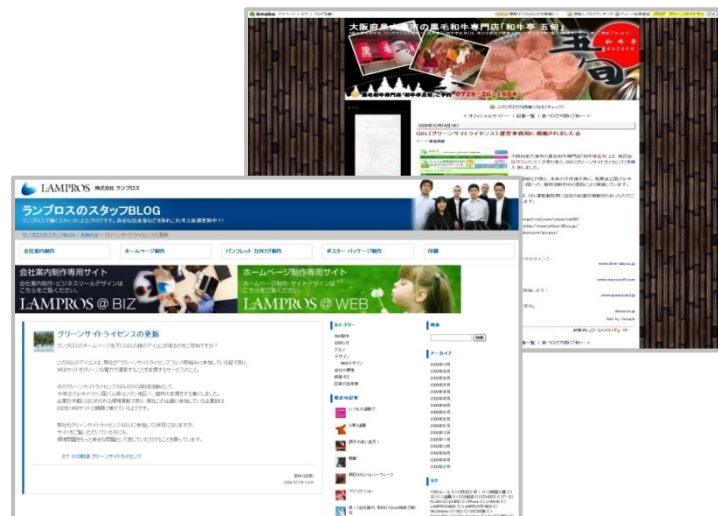
ブログ活用掲載例